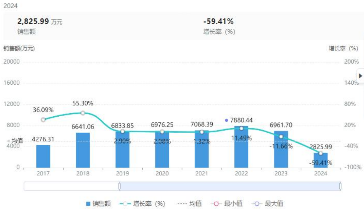
【碳酸钙D3咀嚼片】【销售额】全国医院-年度趋势